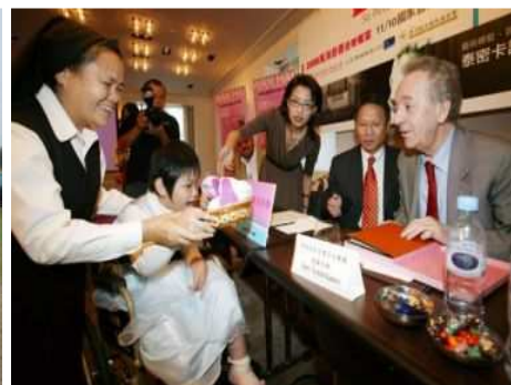
◆身障院童致贈親手做的作品給樂團指揮大師泰密卡諾夫