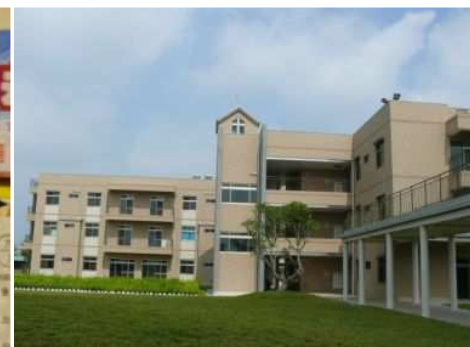
◆敏道家園於 98 年 2 月落成啓用