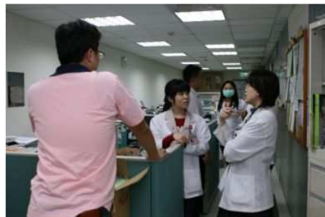
◆ 醫院的社工室是基金會執行救助時重要的合作夥伴