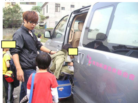
◆ 捐贈永安兒童之家就學專車