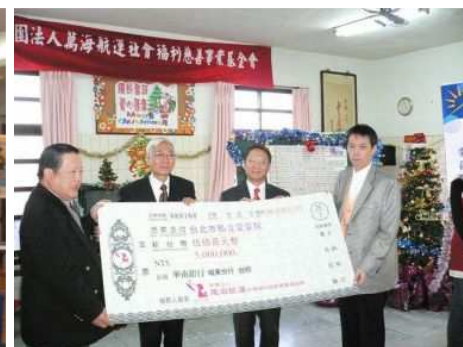
◆捐贈愛愛院募得款項 500 萬