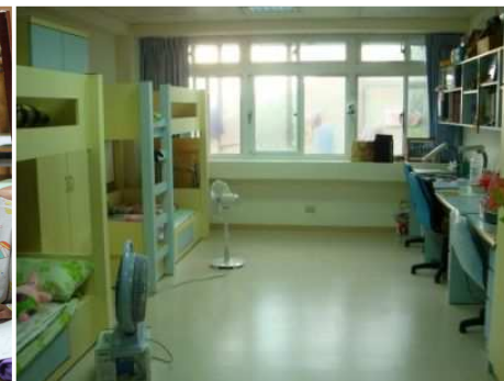
◆ 忠義基金會成立心棧家園，訓練少年學習生活獨立