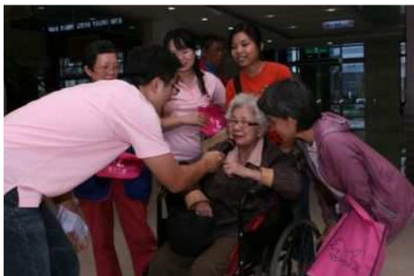
◆ 勸募活動期間基金會至偏鄉醫院辦理急難救助辦法說明會

2010「不離不棄 讓愛繼續」與國家交響樂團(NSO)合作國慶歡樂頌音樂會，門票及募款收入總計 4,513,086 元，全數做為基金會貧窮邊緣家庭扶助專案經費，用於提供受資格限制無法獲得公部門社會扶助卻面臨實際經濟困境的家庭，生活、醫療、教育等層面的照顧與協助。募得款已於民國 100 年 1 月 25 日至 10 月 7 日期間執行完竣，共補助 207 戶家庭，協助度過難關