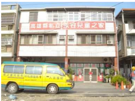
◆原來委身於租賃來由老舊公寓改建的永安兒童之家

2008「我想要回家」邀請英國皇家愛樂管弦樂團來台演出，門票及募款收入全數捐助永安兒童之家興建「永安家園」之用。