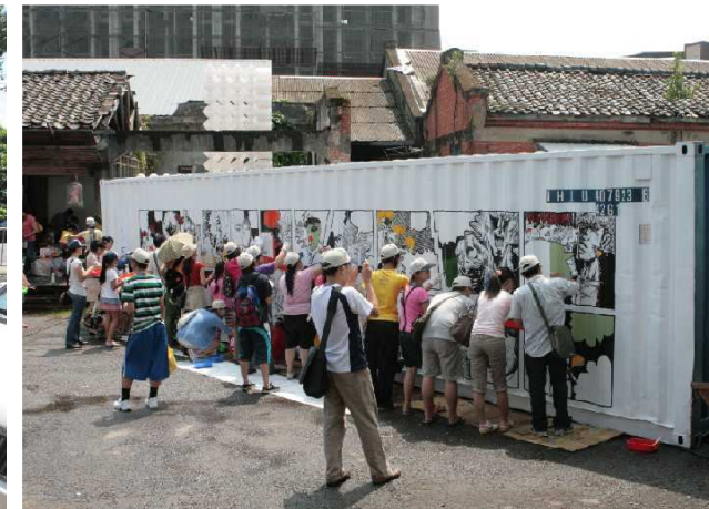
◆百餘人群策群力彩繪貨櫃