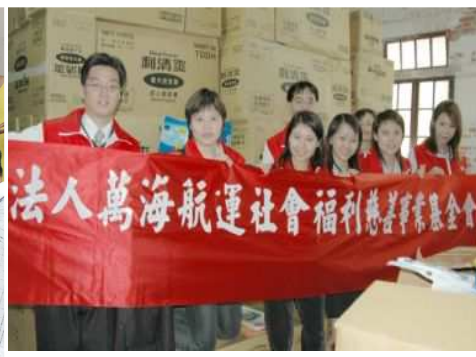
◆ 定期捐贈紙尿布 關懷從日常生活照顧起