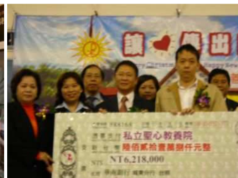
◆捐贈聖心募得款項 621 萬