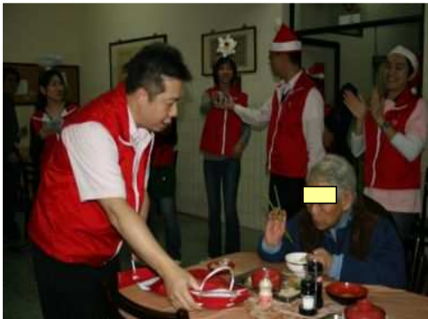
◆聖誕報佳音到老人院