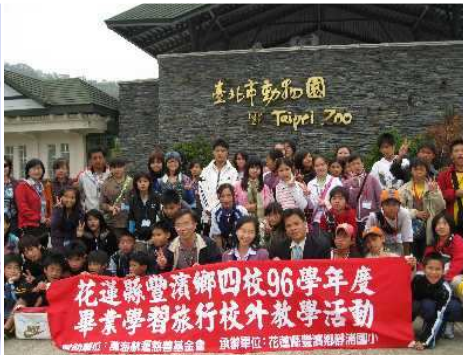
◆豐鄉鄉四校聯合畢旅到動物園