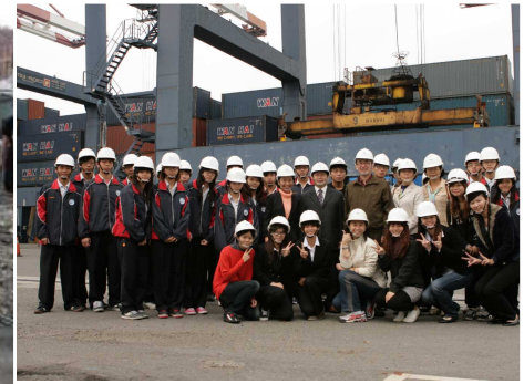
◆ 育才助學金頒獎安排登輪