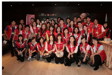
◆ 來聆聽音樂會的都是支持公益的貴人，志工一定要熱心接待