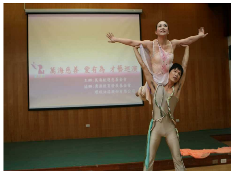
◆ 身障表演者在台上發光發熱

基金會持續關心極光打擊樂團、鳥與水舞集、廣青合唱團等由身障者組成的表演團體在舞台上發光發熱，也支持如：智障者才藝大賽、身障者巡迴影展等活動，讓身心障礙者的才能得以被肯定。更於今年度舉辦「愛有為」第一屆身障才藝大賽，發掘感動人心的表演，除提供獎金鼓勵身障表演者，亦安排一系列至學校、監所的演出，散發正向的人生態度。