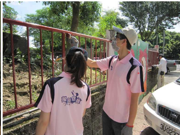
◆大家一起幫老人院外牆粉刷