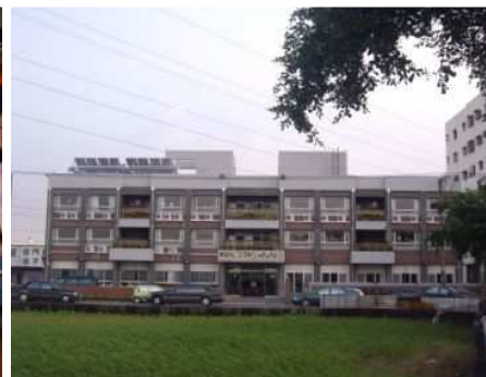
◆永安家園於 99 年 9 月落成啓用