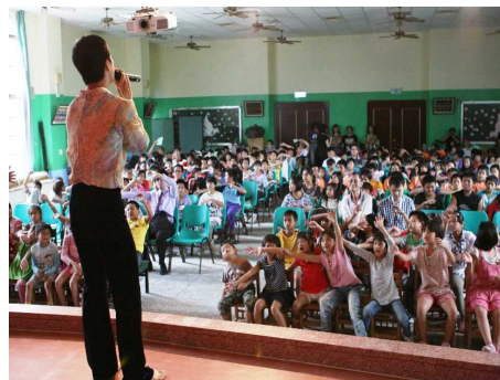
◆ 公益巡演到花蓮偏小小朋友們熱情回應