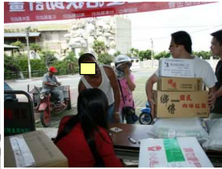
◆ 於鄉鎮市公所發放生活物資