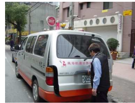
◆ 復康巴士提供身障者行的便利