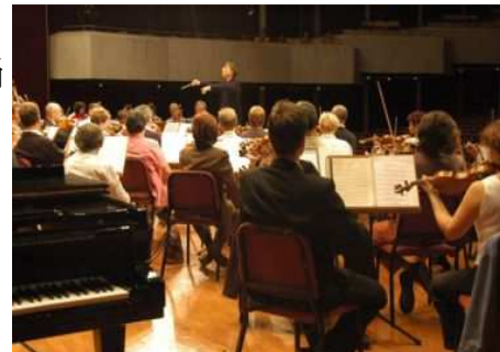
◆指揮瓦薩里帶領樂團排練中