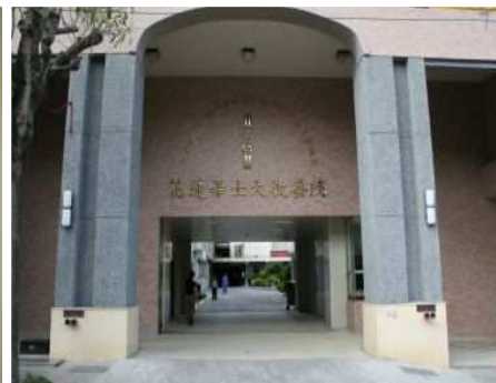
◆完工後的希望樓提供成年身心障礙者技藝學習的場所

2008「我想要回家」邀請英國皇家愛樂管弦樂團來台演出，門票及募款收入全數捐助永安兒童之家興建「永安家園」之用。