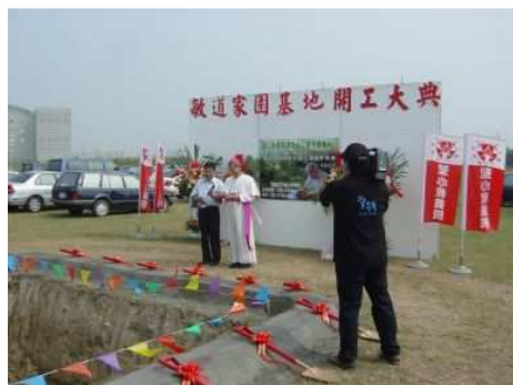
◆敏道家園在各界關心中動工

2006「用愛打造敏道家園」邀請聖彼得堡愛樂管絃樂團來台演出，門票及募款收入全數捐助聖心教養院做為籌建成人重殘養護中心「敏道家園」。