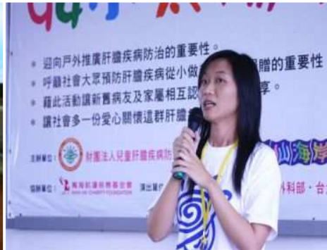
◆病童專用奶粉昂貴 造成家庭負擔 ◆共同宣導病童的照顧之道