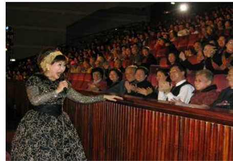
◆資深藝人的精采演出 帶給長輩們快樂的聖誕記憶

2004 邀請匈牙利布達佩斯交響樂團來台舉辦「世紀經典慈善音樂會」，並發起「為折翼天使們打造一個家」，售票及募款收入全數捐贈台北八里樂山療養院建置重殘養護大樓。