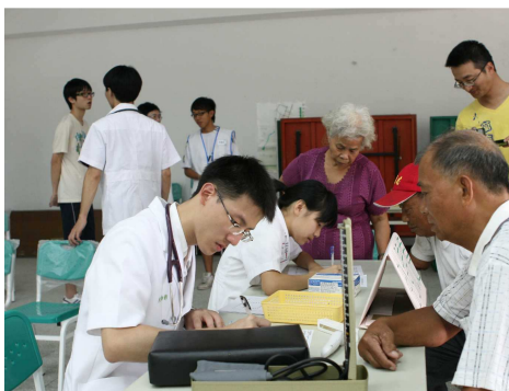
◆ 醫療服務隊走入偏鄉 叮嚀長者要注意健康

偏遠地區普遍缺乏醫療資源，基金會鼓勵青年學子投身服務工作，長期支持大專院校醫療性質服務社團利用寒、暑假期間走進偏遠鄉鎮，提供醫療義診、到宅衛教宣導等服務，累計投入超過 70 個專案，服務超過 7000 人次。