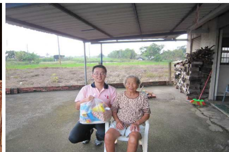
◆ 於中秋節前夕準備了月餅、白米、麥片、拉麵、肉鬆等總計 500 組民生物資，與全國十個社福單位合作，分送給 500 戶弱勢家庭。