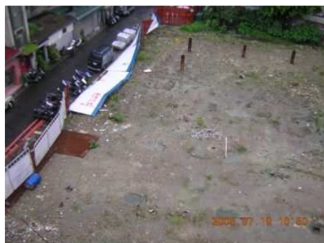
◆愛愛院的工程預定地

2005「以愛築愛巢 疼惜老寶貝」舉辦胡桃鉗、威尼斯商人兒童音樂劇慈善義演，為愛愛院籌措院區擴建工程基金。