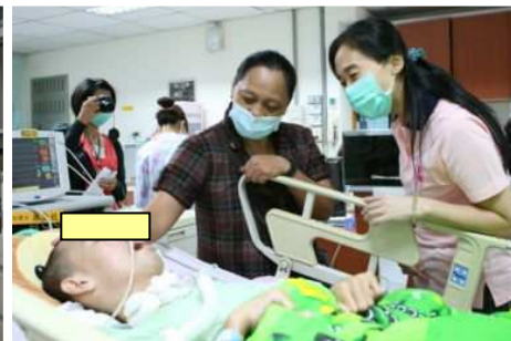
◆ 基金會除經濟的補助，也致贈營養品類的物資給需求的家庭