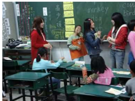
◆ 寒假語文學習課程