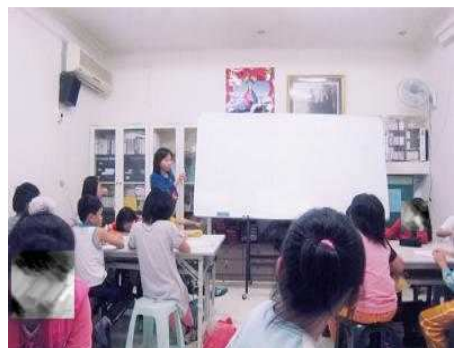
◆ 服務台中地區弱勢家庭學童