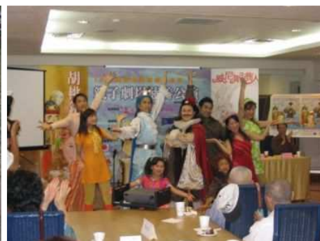
◆大風劇團成功吸引親子觀眾