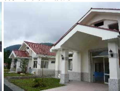
◆ 贊助阿尼色弗南投分院建院