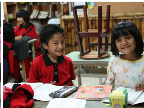
◆ 修繕山美部落教室，學童下課有去處