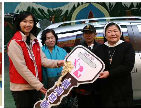
◆ 捐贈阿里山服務專車，社工訪 視長輩/身障者交通無礙