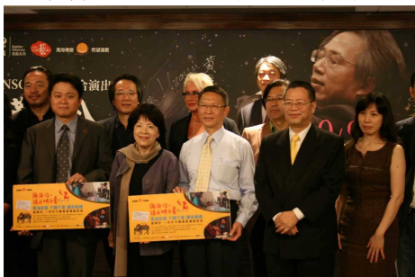
◆ 記者會上指揮呂紹嘉老師和基金會一起呼籲大家關心近貧

2011 持續推動「不離不棄 讓愛繼續」募款活動，與國家交響樂團(NSO)合作 10 月 9 日馬勒第八千人歡唱音樂會，門票及募款收入全數做為基金會貧窮邊緣家庭扶助專案經費，用於提供受資格限制無法獲得公部門社會扶助卻面臨實際經濟困境的家庭，生活、醫療、教育等層面的照顧與協助。募得款已於民國 101 年 2 月 3 日至 9 月 14 日期間執行完竣，共補助 220 戶家庭，協助度過難關