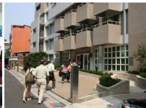
◆松柏樓於 97 年 12 月落成啓用

2006「用愛打造敏道家園」邀請聖彼得堡愛樂管絃樂團來台演出，門票及募款收入全數捐助聖心教養院做為籌建成人重殘養護中心「敏道家園」。