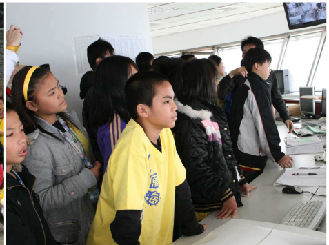
◆學童參觀基隆港塔台