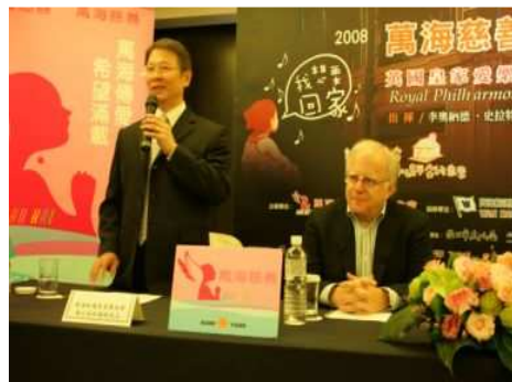
◆樂團指揮史拉特金親臨記者會宣告慈善音樂會的演出訊息