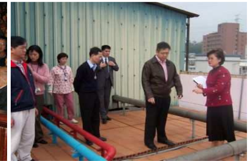
◆基金會陳董事長親自了解浩然敬老院隔熱工程進度