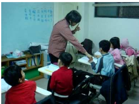
◆ 聽障學童課後輔導

為提升弱勢兒童課業興趣及學習成就，基金會贊助服務單位執行提供經濟弱勢家庭或身心障礙學童之課業輔導，期望透過學習興趣的引發和學習成就的提升，讓教育成為孩子們人生的轉捩點。