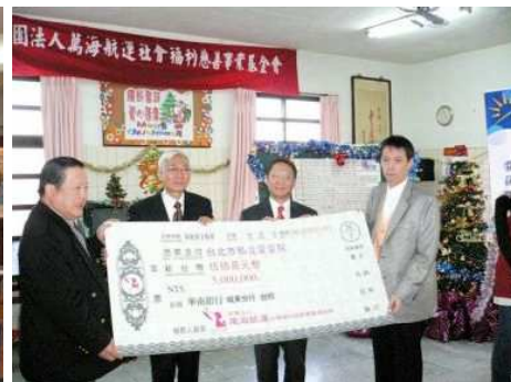
◆捐贈愛愛院募得款項 500 萬