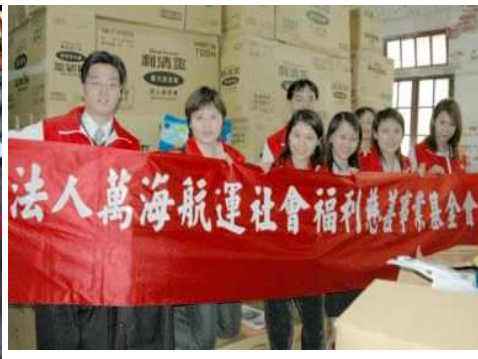
◆ 定期捐贈紙尿布 關懷從日常生活照顧起