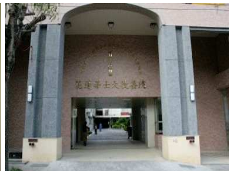
◆完工後的希望樓提供成年身心障礙者技藝學習的場所

2008「我想要回家」邀請英國皇家愛樂管弦樂團來台演出，門票及募款收入全數捐助永安兒童之家興建「永安家園」之用。