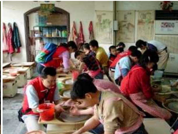
◆帶著身心障礙小朋友鶯歌捏陶去