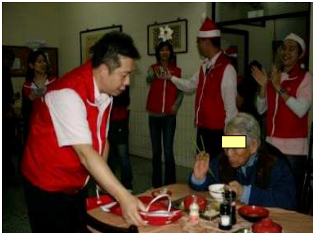
◆聖誕報佳音到老人院