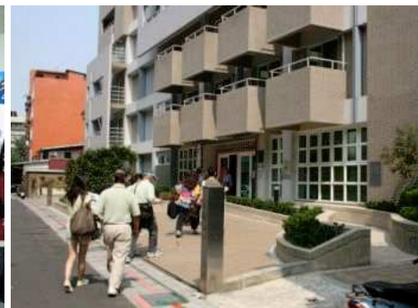
◆松柏樓於 97 年 12 月落成啓用

2006「用愛打造敏道家園」邀請聖彼得堡愛樂管絃樂團來台演出，門票及募款收入全數捐助聖心教養院做為籌建成人重殘養護中心「敏道家園」。