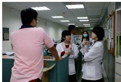
◆ 醫院的社工室是基金會執行救助時重要的合作夥伴