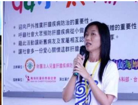
◆病童專用奶粉昂貴 造成家庭負擔 ◆共同宣導病童的照顧之道