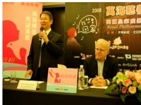
◆樂團指揮史拉特金親臨記者會宣告慈善音樂會的演出訊息