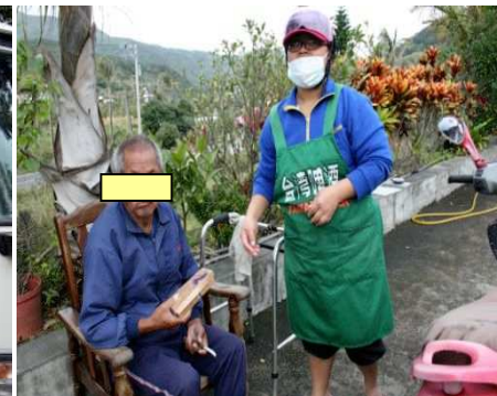
◆ 愛心餐盒每日送達 再遠也不能讓長輩餓著