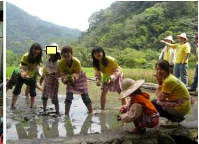
◆大手牽小手 春日插秧初體驗