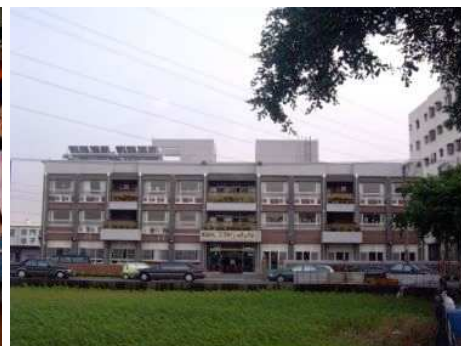
◆永安家園於 99 年 9 月落成啓用