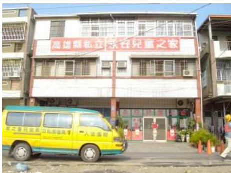
◆原來委身於租賃來由老舊公寓改建的永安兒童之家

2008「我想要回家」邀請英國皇家愛樂管弦樂團來台演出，門票及募款收入全數捐助永安兒童之家興建「永安家園」之用。