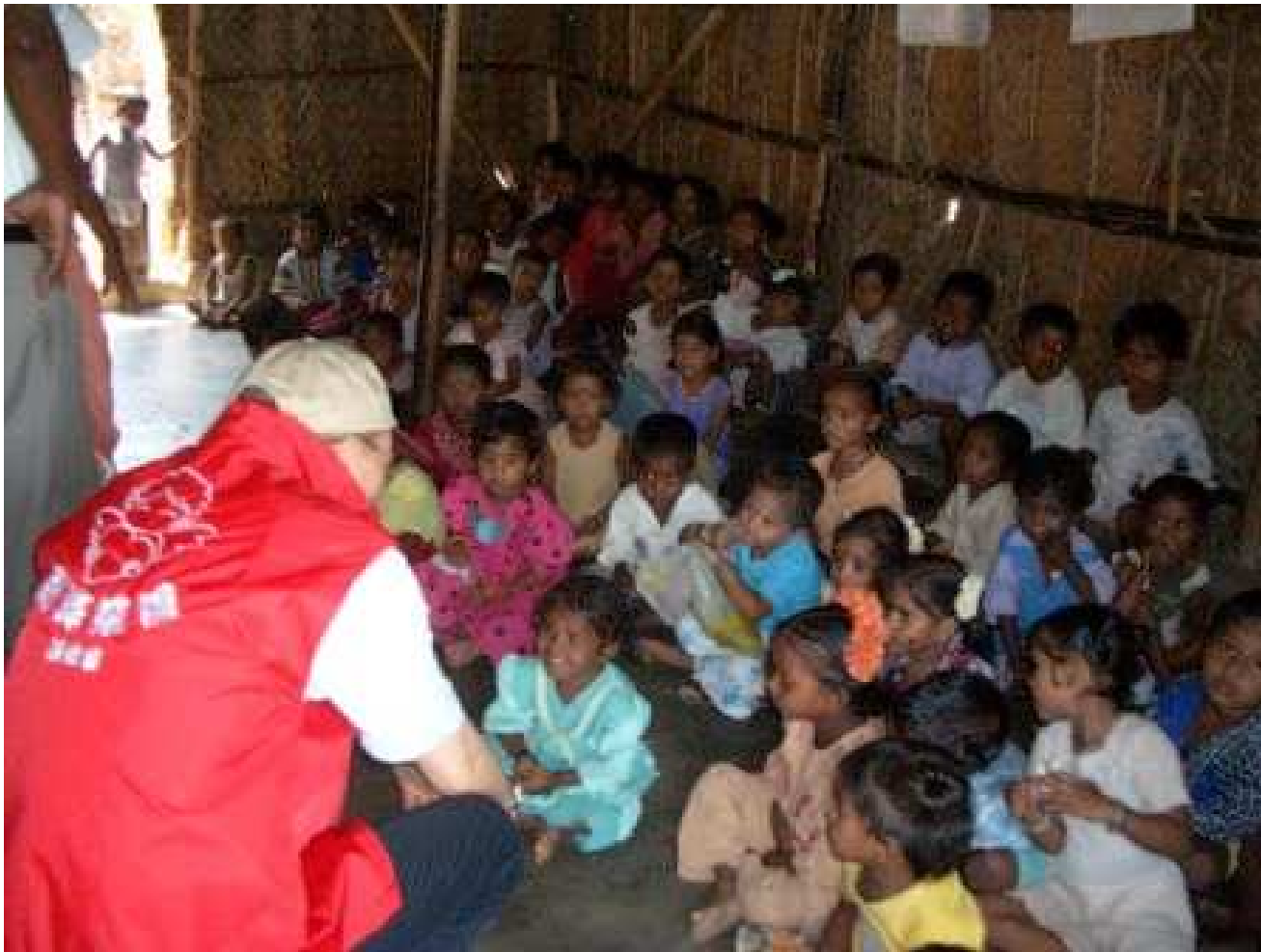
與台北靈糧堂合作使用於印度南部 Chennai 興建永久性社區兒童學習中心