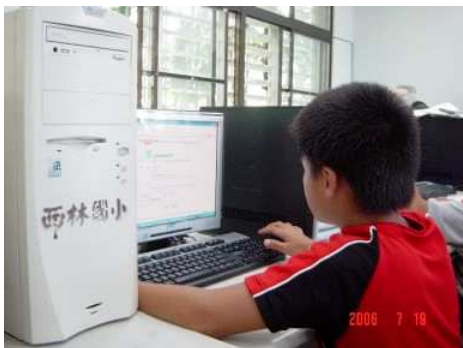
◆ 偏遠地區有設備卻缺少師資