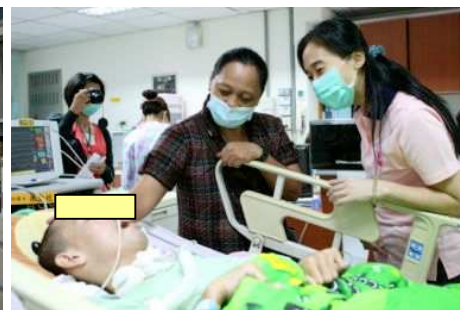
◆ 基金會除經濟的補助，也致贈營養品類的物資給需求的家庭