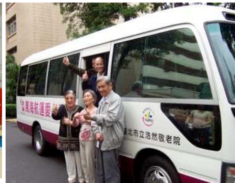
◆ 捐贈愛心敬老專車 提供長者日常就醫交通