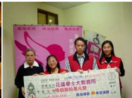
◆捐贈畢士大募得款項 680 萬