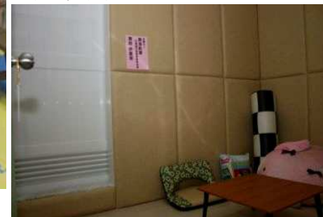
◆ 基金會捐助設立抒壓室