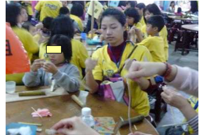
◆頭城農場體驗竹藝 DIY

由萬海航運慈善基金會定期規劃志工活動，活動性質包含：育幼院院童或弱勢家庭兒童戶外體驗活動、老人院長者探訪活動並提供餘興節目及按摩服務、教養院到院關懷活動提供餵飯協助及團康餘興節目等；此外，舉凡由萬海航運慈善基金會所贊助的公益活動，亦招募志工投入活動現場的服務工作行列，可謂出錢又出力，受到協助的單位都說實在「足感心ㄟ」。