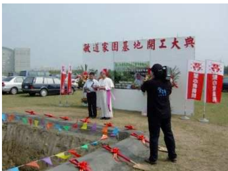
◆敏道家園在各界關心中動工

2006「用愛打造敏道家園」邀請聖彼得堡愛樂管絃樂團來台演出，門票及募款收入全數捐助聖心教養院做為籌建成人重殘養護中心「敏道家園」。