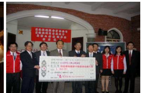
◆致贈樂山募得款項 604 萬