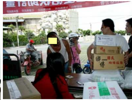
◆ 於鄉鎮市公所發放生活物資