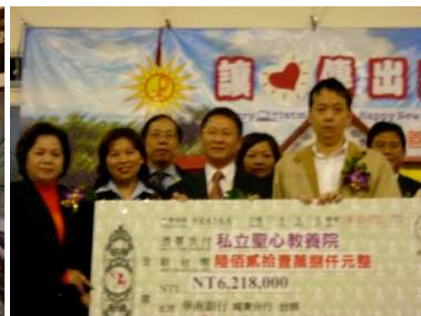
◆捐贈聖心募得款項 621 萬