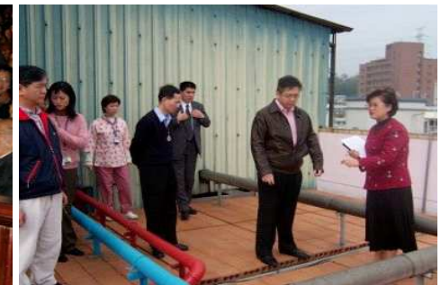
◆基金會陳董事長親自了解浩然敬老院隔熱工程進度