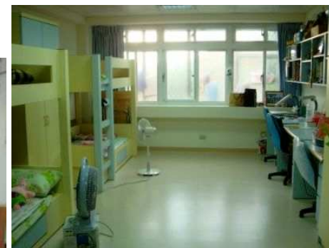
◆ 忠義基金會成立心棧家園，訓練少年學習生活獨立