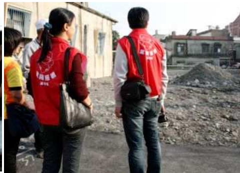
◆ 訪視屏東佳冬地區八八受災