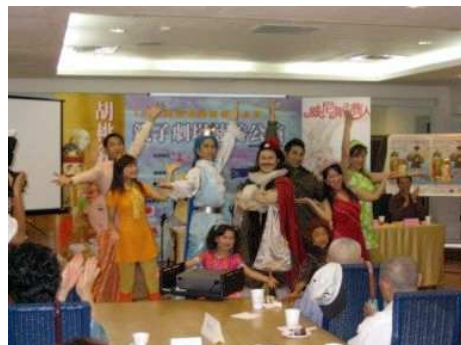
◆大風劇團成功吸引親子觀眾