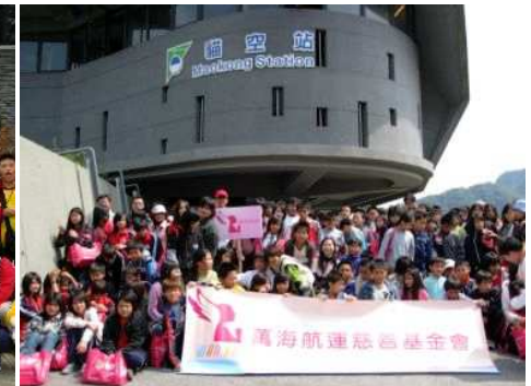
◆豐鄉鄉四校聯合畢旅到動物園