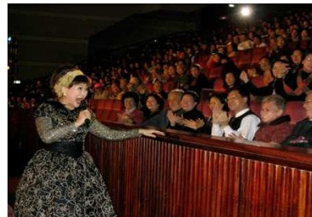
◆資深藝人的精采演出 帶給長輩們快樂的聖誕記憶

2004 邀請匈牙利布達佩斯交響樂團來台舉辦「世紀經典慈善音樂會」，並發起「為折翼天使們打造一個家」，售票及募款收入全數捐贈台北八里樂山療養院建置重殘養護大樓。