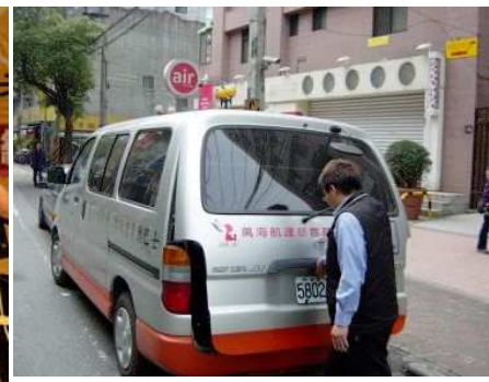
◆ 復康巴士提供身障者行的便利