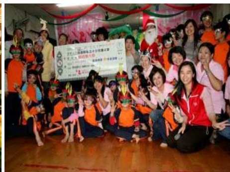
◆捐贈永安募得款項 800 萬