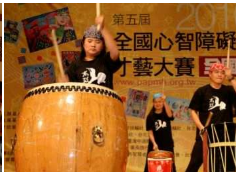
◆ 智障者才藝大賽 參賽者專注的神情震撼人心