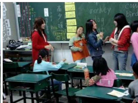
◆ 寒假語文學習課程