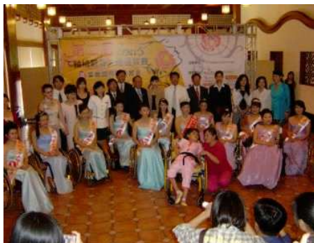
◆ 輪椅親善大使選拔 因為自信散發力量