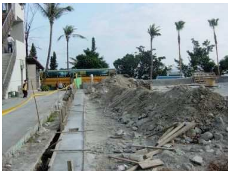
◆興建中的希望樓面臨工程尾款的困境

2007「喜樂庇護畢士大」邀請捷克愛樂管弦樂團來台演出，門票及募款收入全數捐助畢士大教養院做為籌建庇護大樓「希望樓」。