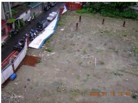
◆愛愛院的工程預定地

2005「以愛築愛巢 疼惜老寶貝」舉辦胡桃鉗、威尼斯商人兒童音樂劇慈善義演，為愛愛院籌措院區擴建工程基金。