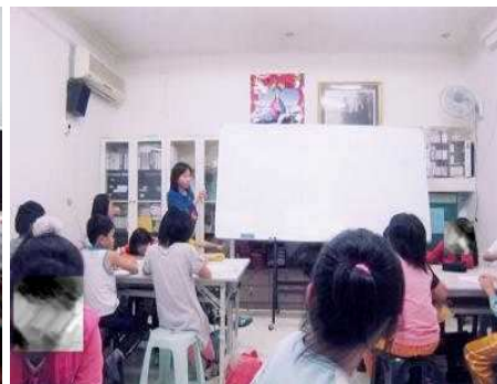
◆ 服務台中地區弱勢家庭學童