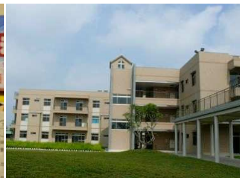
◆敏道家園於 98 年 2 月落成啓用