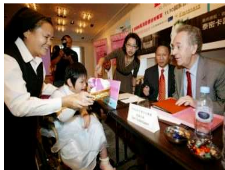
◆身障院童致贈親手做的作品給樂團指揮大師泰密卡諾夫