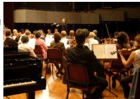
◆指揮瓦薩里帶領樂團排練中