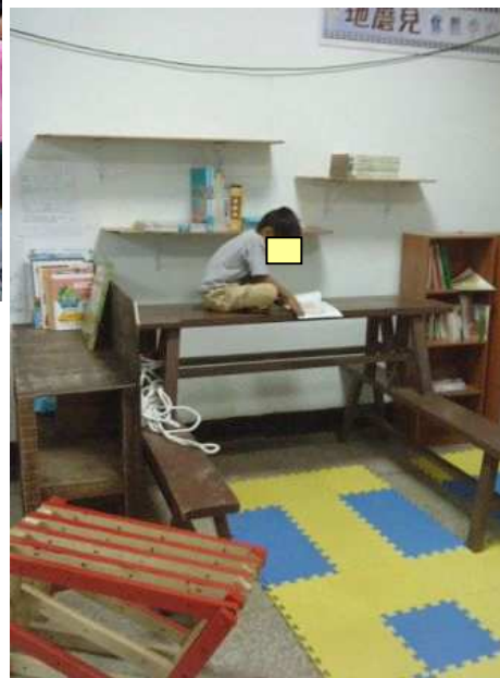
◆ 收容八八災民的屏東龍泉營區設立讀書角，鼓勵閱讀

基金會受理公益單位提案，提供有益於兒童福利發展的服務方案經費贊助，例如：捐贈忠義育幼院「心棧家園」青少年訓練教室設備、贊助收容八八災民的屏東龍泉營區設立讀書角，鼓勵安置中心學童閱讀。