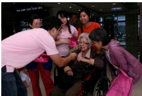
◆ 勸募活動期間基金會至偏鄉醫院辦理急難救助辦法說明會

2010「不離不棄 讓愛繼續」與國家交響樂團(NSO)合作國慶歡樂頌音樂會，門票及募款收入全數做為基金會貧窮邊緣家庭扶助專案經費，用於提供受資格限制無法獲得公部門社會扶助卻面臨實際經濟困境的家庭，生活、醫療、教育等層面的照顧與協助。