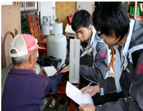
◆ 醫療服務隊走入偏鄉 叮嚀長者要注意健康

偏遠地區普遍缺乏醫療資源，基金會鼓勵青年學子投身服務工作，長期支持大專院校醫療性質服務社團利用寒、暑假期間走進偏遠鄉鎮，提供醫療義診、到宅衛教宣導等服務，累計投入超過 40 個專案，服務超過 4000 人次。