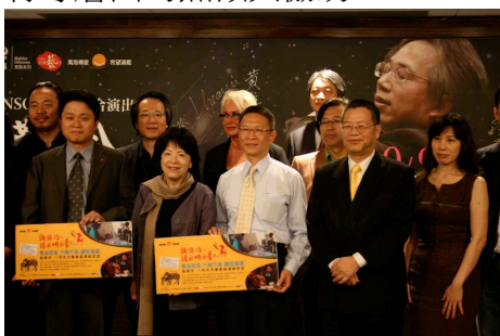
◆ 記者會上指揮呂紹嘉老師和基金會一起呼籲大家關心近貧

2011 持續推動「不離不棄 讓愛繼續」募款活動，與國家交響樂團(NSO)合作 10 月 9 日馬勒第八千人歡唱音樂會，門票及募款收入全數做為基金會貧窮邊緣家庭扶助專案經費，用於提供受資格限制無法獲得公部門社會扶助卻面臨實際經濟困境的家庭，生活、醫療、教育等層面的照顧與協助。