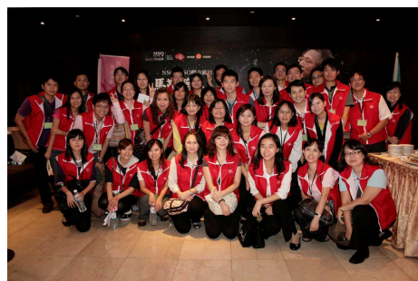
◆ 來聆聽音樂會的都是支持公益的貴人，志工一定要熱心接待