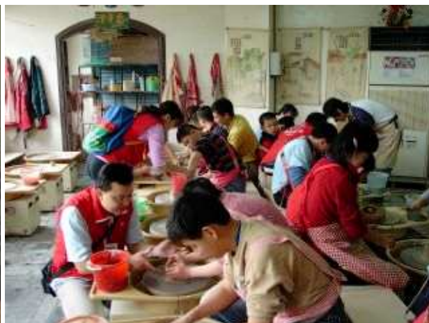
◆帶著身心障礙小朋友鶯歌捏陶去