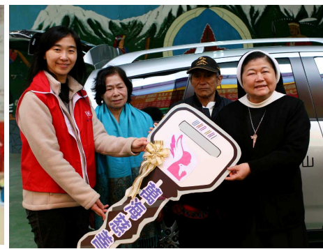
◆ 捐贈阿里山服務專車，社工 訪視長輩/身障者交通無礙