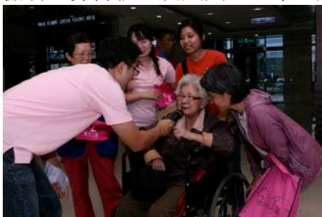
◆ 勸募活動期間基金會至偏鄉醫院辦理急難救助辦法說明會

2010「不離不棄 讓愛繼續」與國家交響樂團(NSO)合作國慶歡樂頌音樂會，門票及募款收入總計 4,513,086 元，全數做為基金會貧窮邊緣家庭扶助專案經費，用於提供受資格限制無法獲得公部門社會扶助卻面臨實際經濟困境的家庭，生活、醫療、教育等層面的照顧與協助。募得款已於民國 100 年 1 月 25 日至 10 月 7 日期間執行完竣，共補助 207 戶家庭，協助度過難關