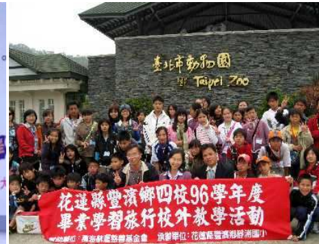
◆豐鄉鄉四校聯合畢旅到動物園