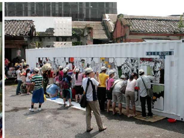
◆百餘人群策群力彩繪貨櫃