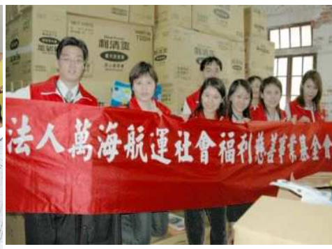
◆ 定期捐贈紙尿布 關懷從日常生活照顧起