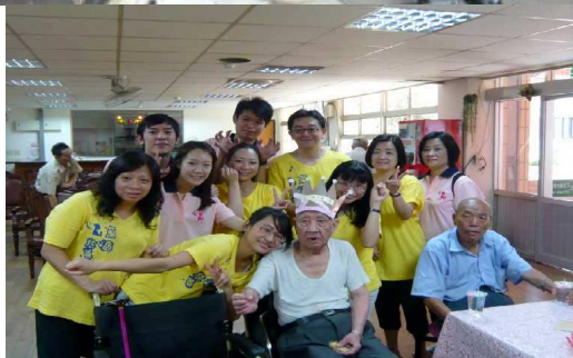
老歌加按摩 共度美好午後