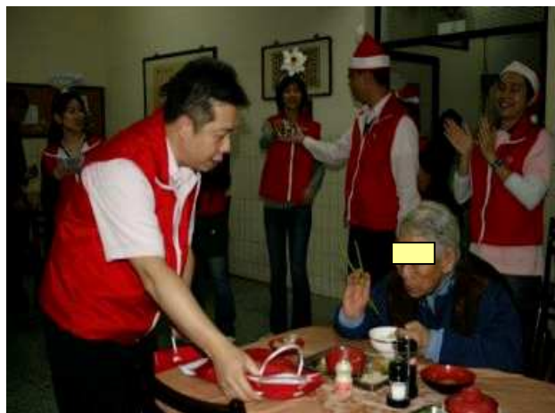
◆聖誕報佳音到老人院