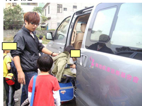
◆ 捐贈永安兒童之家就學專車