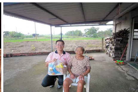
◆ 於中秋節前夕準備了月餅、白米、麥片、拉麵、肉鬆等總計 500 組民生物資，與全國十個社福單位合作，分送給 500 戶弱勢家庭。