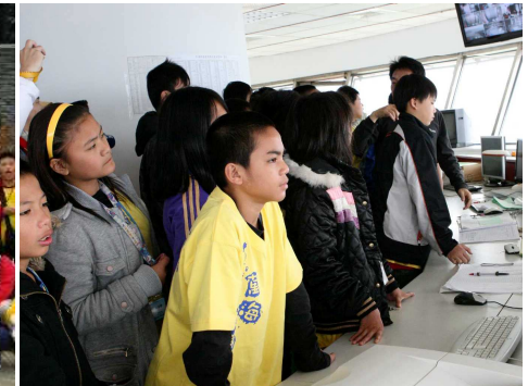
◆學童參觀基隆港塔台