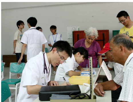
◆ 醫療服務隊走入偏鄉 叮嚀長者要注意健康

偏遠地區普遍缺乏醫療資源，基金會鼓勵青年學子投身服務工作，長期支持大專院校醫療性質服務社團利用寒、暑假期間走進偏遠鄉鎮，提供醫療義診、到宅衛教宣導等服務，累計投入超過 50 個專案，服務超過 5000 人次。