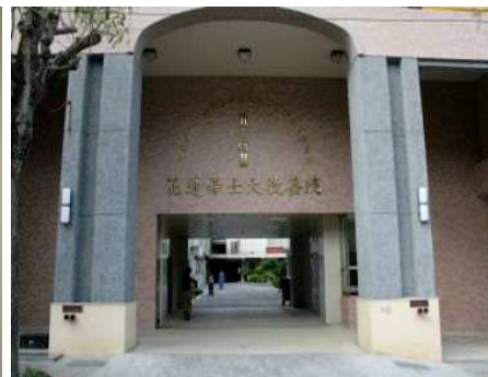
◆完工後的希望樓提供成年身心障礙者技藝學習的場所

2008「我想要回家」邀請英國皇家愛樂管弦樂團來台演出，門票及募款收入全數捐助永安兒童之家興建「永安家園」之用。