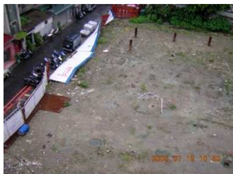
◆愛愛院的工程預定地

2005「以愛築愛巢 疼惜老寶貝」舉辦胡桃鉗、威尼斯商人兒童音樂劇慈善義演，為愛愛院籌措院區擴建工程基金。