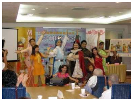
◆大風劇團成功吸引親子觀眾