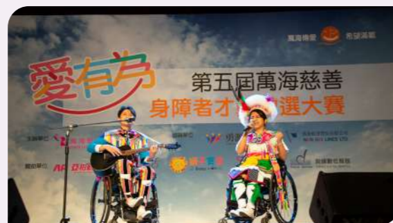
【愛有為】身障才藝大賽精湛的演技震撼全場觀眾