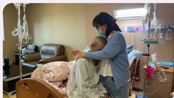
急難救助專案協助案家走過困境