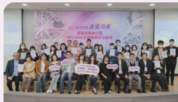
【讓愛閃耀】專案捐贈儀式，促進社福單位交流與學習