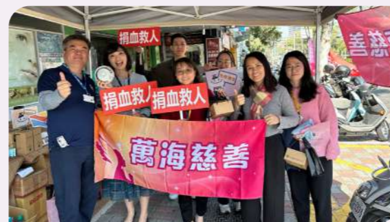
萬海同仁們熱血響應捐血活動。