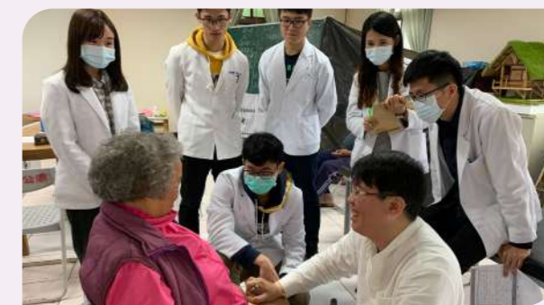
【當我們同在醫起】支持大專醫療社團前進偏鄉進行義診